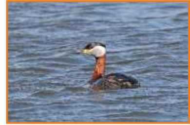
Rothalstaucher (A. Schade)

Auf der Fahrt zu unserem heutigen Haupt-Exkursionsgebiet, dem Beltringharder Koog, legen wir einen Zwischenstopp bei einem langen Holzsteg ein, der uns ins Watt hinausführt.