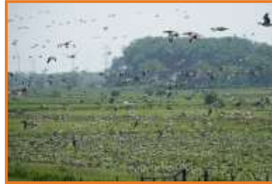
Weißwangengänse (A. Schade)