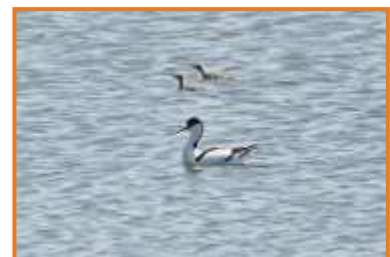
Säbelschnäbler mit Pulli (A. Schade)

Wir genießen den Blick vom Holzsteg ins Watt mit Pfuhschnepfen, Kiebitzregenpfeifern, Alpenstrandläufern und Ringelgänsen, eine männliche Rohrweihe fliegt dicht übers Schilf. Beim Rückweg singt der Schilfrohrsänger wieder nahe beim Weg. Und zu unserer großen Freude kommt ein kleiner Trupp von Bartmeisen vorbei. Erst fliegen sie weiter, kommen aber dann sogar ein weiteres Mal heran und sind dabei