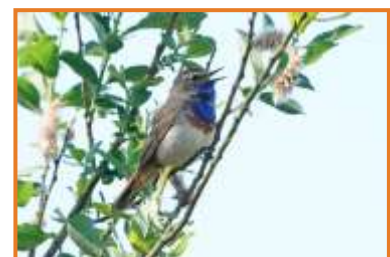
Blaukehlchen (A. Schade)