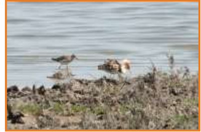
Kampfläufer (A. Schade)