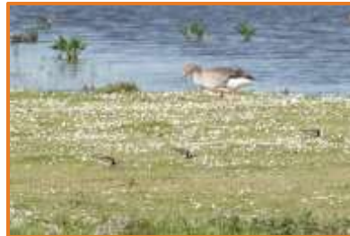
Steinwälzer + Graugans (A. Schade)