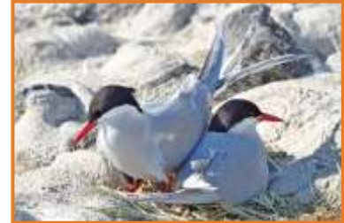
Küstenseeschwalben (A. Schade)

Beim leckeren Abendessen im Hotel können wir direkt auf die Eider und das Eiderwatt hinausblicken.