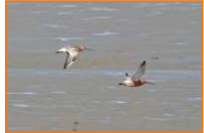
Pfuhlschnepfe (A. Schade)