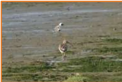
Großer Brachvogel + Kiebitzregenpfeifer (A. Schade)