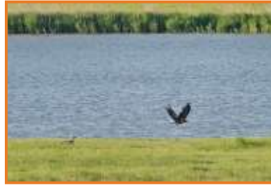
Zwei Seeadler (A. Schade)