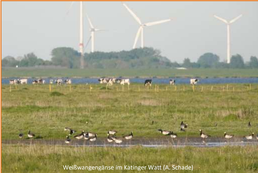
Weißwangengänse im Katinger Watt (A. Schade)

Weißwangengänse, Kampfläufer im Prachtkleid und Blaukehlchen ganz nah