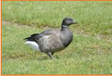
Ringelgans (A. Schade)