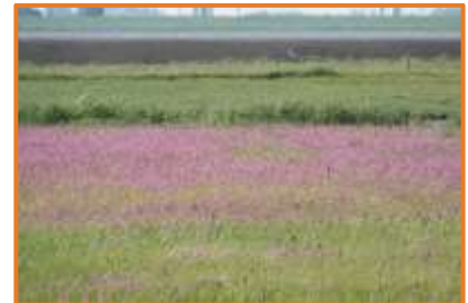
Farbenpracht mit Kuckucks-Lichtnelken und Knabenkraut (A. Schade)

Nach morgendlichem Auschecken und Frühstück fahren wir zum Abschluss nochmals zum Beobachtungsturm im Katinger Watt, wo uns gleich wieder singende Feldlerchen und Wiesenpieper erfreuen. Vom Turm aus ist heute neben weiteren Limikolen, Gänsen und Enten auch ein Seeregenpfeifer zu finden, der allerdings erst einmal recht schnell wieder verschwindet. Zwischenzeitlich lässt sich als besonderes Highlight ein Sumpfläufer entdecken. Er bleibt etwas länger vor Ort und der Seeregenpfeifer kommt ebenfalls wieder zurück, so dass auch ihn alle im Spektiv betrachten können. Und auch sechs Seeadler, etliche Uferschnepfen, ein Temminck- und mehrere Zwergstrandläufer, Sandregenpfeifer, Rotschenkel, Kiebitze mit Pulli, Säbelschnäbler, Knäk- und Löffelenten, Wiesenpieper, sowie die Rauchschnalben im Turm bereiten uns einen wundervollen Abschied von dieser schönen, arten- und erlebnisreichen Reise.