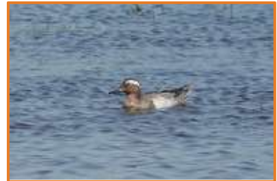
Knäkente (A. Schade)