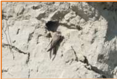
Uferschwalbe (A. Schade)