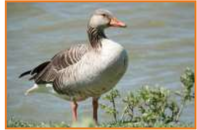
Graugans (A. Schade)