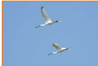
Löffler (A. Schade)