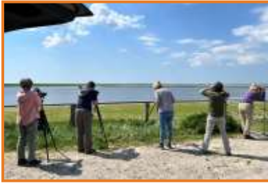
Reisegruppe (A. Schade)