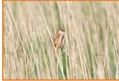
Bartmeise (A. Schade)