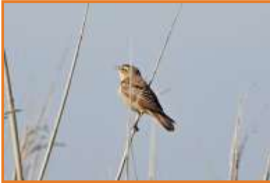
Schilfrohrsänger (A. Schade)