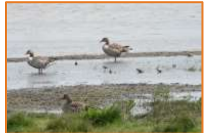
Odinshühnchen, Alpenstrand- läufer + Graugänse (A. Schade)