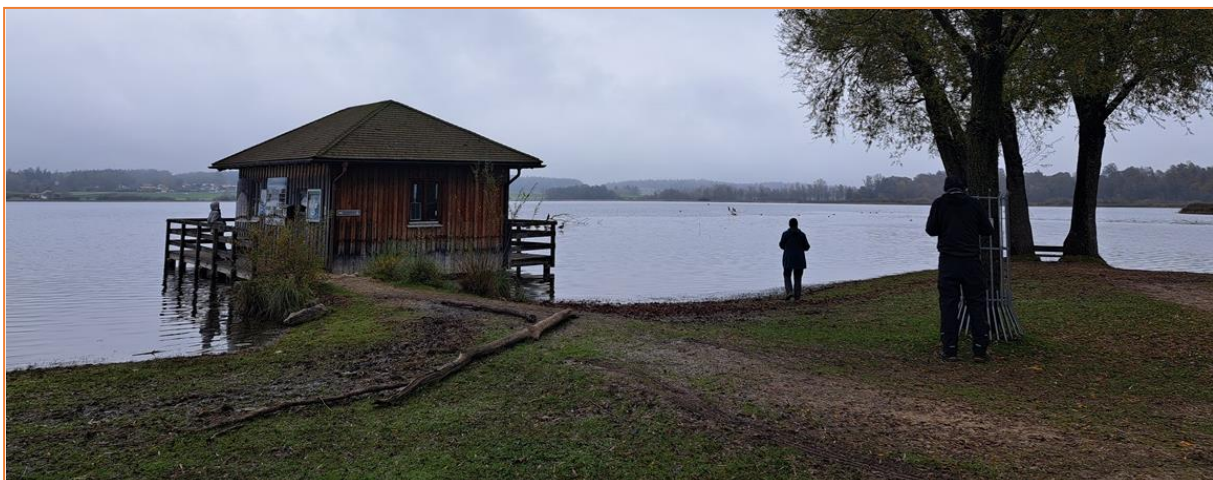
Am Naturschutz Pavillon Schafwaschener Bucht

Die Schafwaschener Bucht am Mündungsdelta der Prien - unser erster Stopp am Chiemsee – ist voller Vögel. Es sind vor allem Stock-, Löffel-, Reiher-, Tafel-, Pfeif-, Krick-, Schnatter- und auch Schellenten, ergänzt von Hauben- und Zwergtauchern und einem sehr späten Schilfrohrsänger. Neben Lach- und Mittelmeermöwen sind auch zwei Zwergmöwen in der der kleinen Bucht, die nach ihrer typischen Art und Weis seeschwalbenartig Nahrung von der Wasseroberfläche pickten.