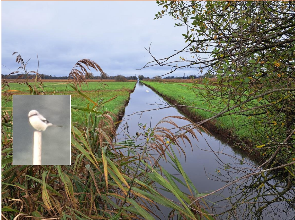
Raubwürger im Grabenstätter Moos