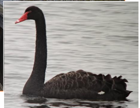
Beobachtungsplattform bei Chieming, Schwarzschan

Nach einem kurzen Stopp am Autobahnrastplatz Chiemsee mit Blick auf Frauen- und Herreninsel ging es zum Irschener Winkel, wo wir mit Rohrweihe, Schwarzhalstaucher und 4 Zwergscharben gleich mehrere Highlights zu notieren hatten.