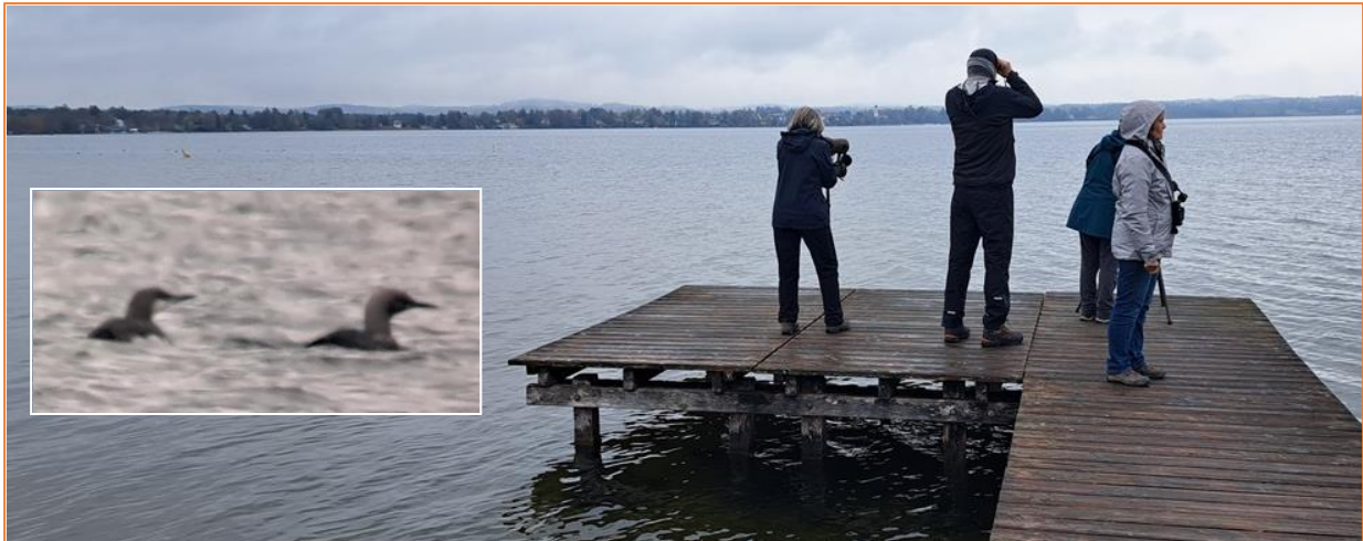
Prachttaucher auf dem Starnberger See

Nach letzten Beobachtungen am Ammersee verließen wir Dießen und wechselten zum zweiten Hotel nach Seebruck am Chiemsee. Dazwischen liegt der Starnberger See, an dem wir Seetaucher suchen wollten. Und tatsächlich fanden wir hier gleich einige Prachttaucher, die bei Sesshaupt sich etwas weiter entfernt aufhielten, bei St. Heinrich dann aber wesentlich besser zu sehen waren.