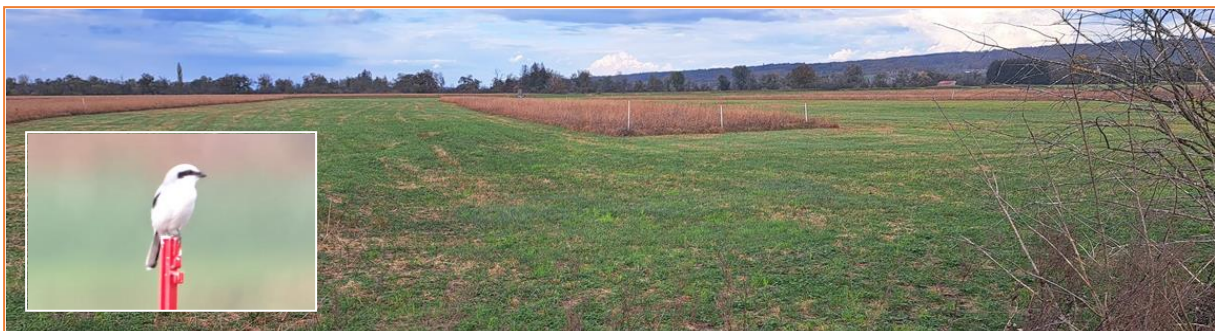
Raubwürger in den Raistingер Wiesen

Nach einer kleinen Mittagspause in Herrsching, blickten wir noch bei den Wasservögeln in der Herrschinger Bucht sowie bei Aidenried vorbei, bevor wir zum Tagesabschluss die Raistingер Wiesen besuchten. Hier zeigten sich Goldammer, Rotmilan, Mäusebussard und Raubwürger sowie in den Nasswiesen kleine Gruppen von Bergpiepern.