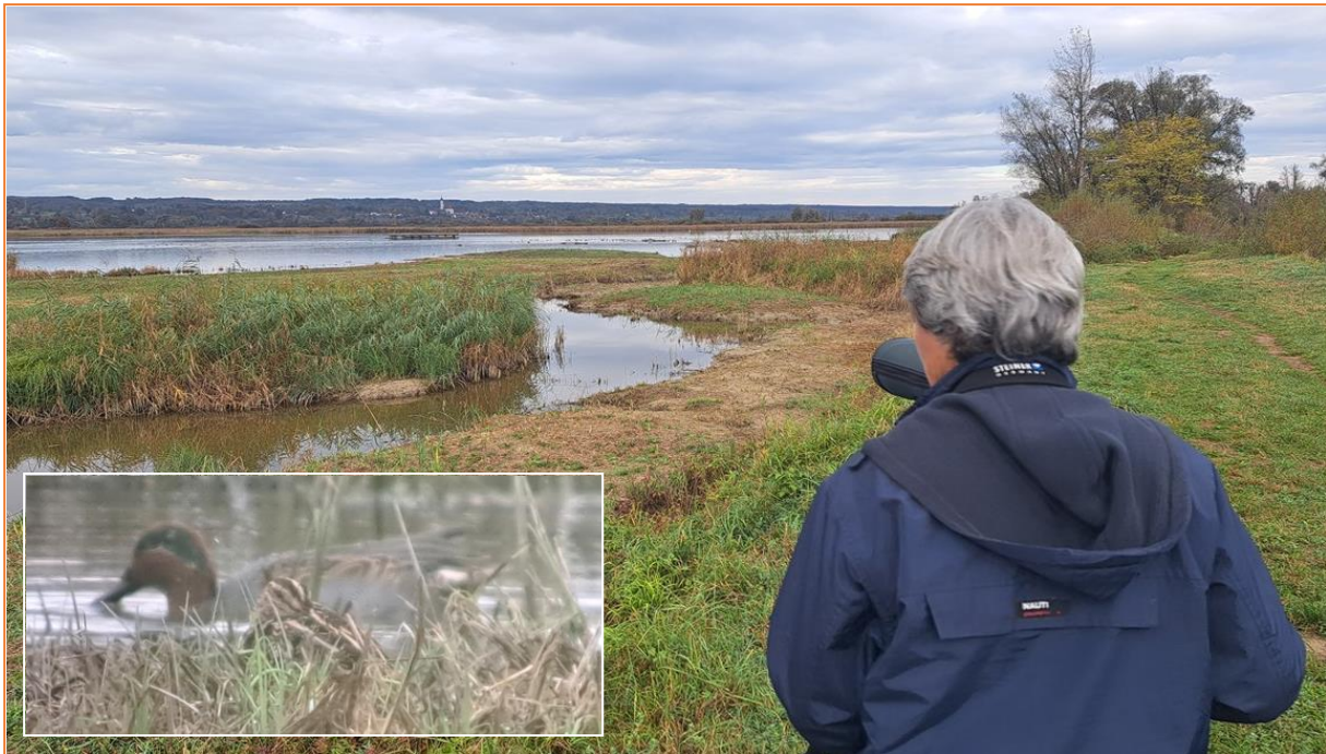
Bekassine und Krickente am Binnensee

Zuerst gingen wir auf dem Ammerdamm in Richtung Ammermündung zum Binnensee. Meisen, Drosseln, Finken und Spechte (Bunt- und Mittels.) begleiteten uns. Am Binnensee erwarteten uns viele Entenvögel wie z.B. Krick-, Schnatter-, Reiher-, Tafel- und Pfeifente. Höhepunkt war neben einigen Bekassinen zwei sich streitende Rohrdommeln entlang des gegenüberliegenden Schilfgürtels.