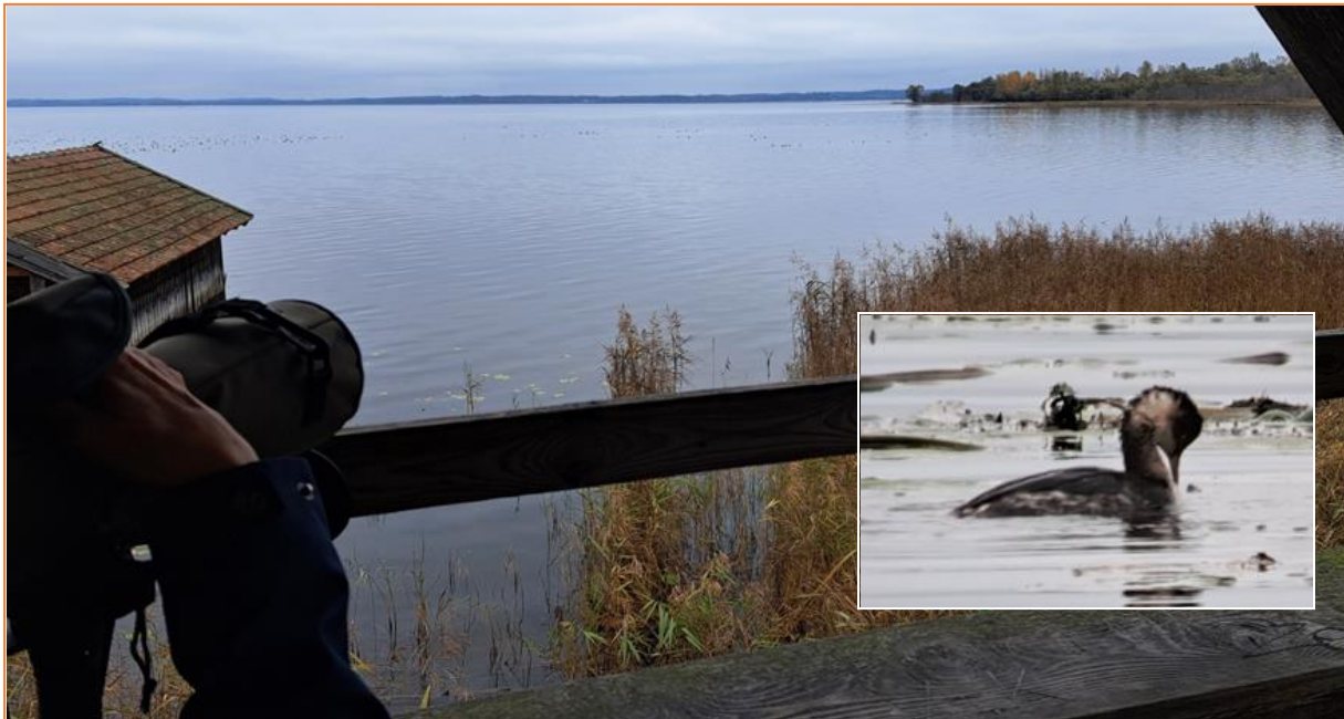
Schwarzhalstaucher in der Hirschauer Bucht

Zurück im Hotel genossen wir noch einen Blick über den Chiemsee und konnten dabei zwei Alpenstrandläufer aus nächster Nähe bestens beobachten.