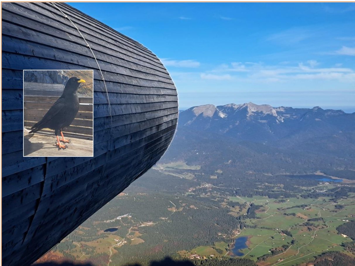
Alpendohle am Karwendel