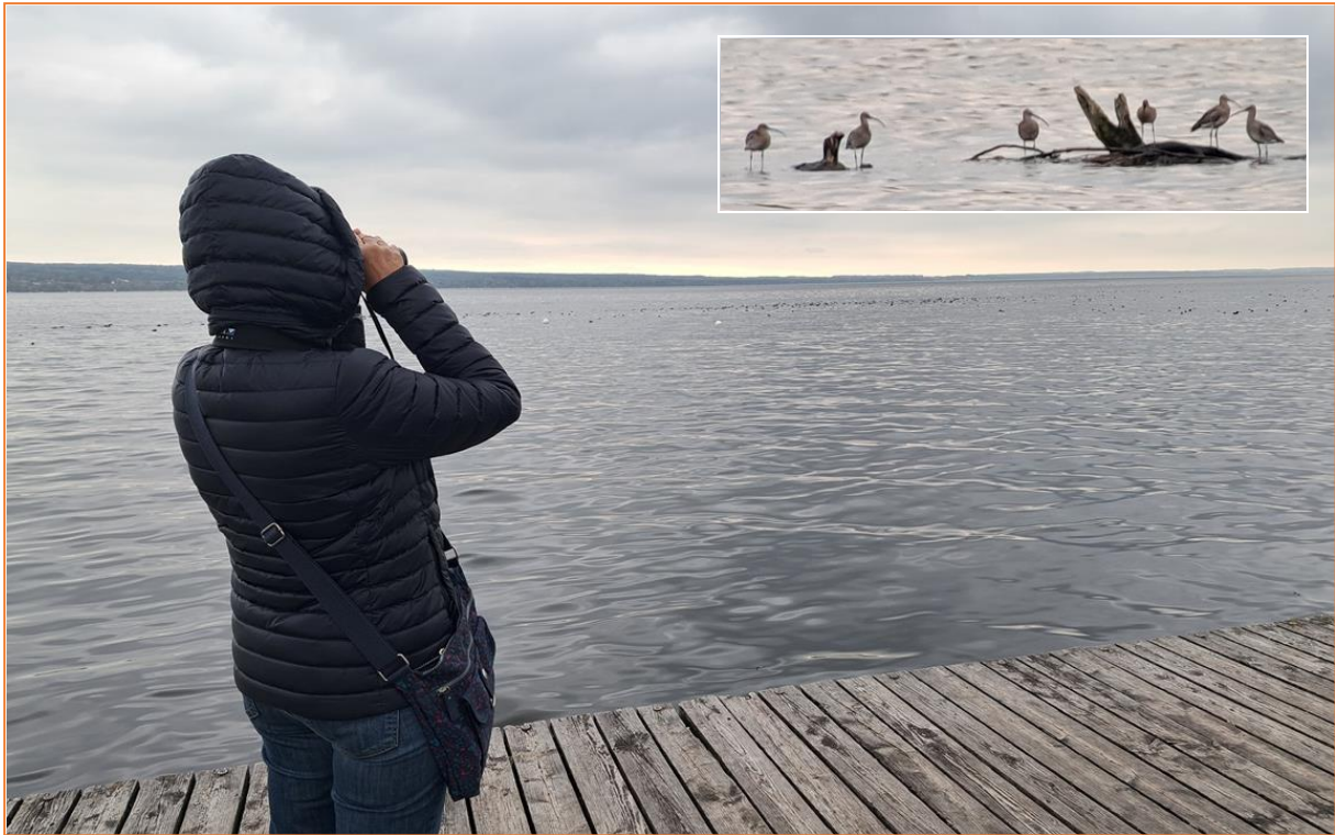
Brachvögel auf dem Ammersee

Kolbenenten, auch Gänsesäger und einige Brachvögel.