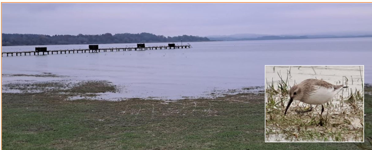
Alpenstrandläufer am Chiemsee

Zurück im Hotel genossen wir noch einen Blick über den Chiemsee und konnten dabei zwei Alpenstrandläufer aus nächster Nähe bestens beobachten.