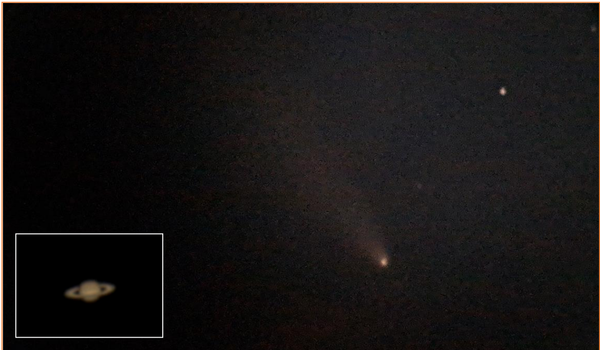
Komet Tsuchinshan-ATLAS & Ringplanet Saturn

Zum Tagesabschluss unternahmen wir noch einen kleinen aber feinen Spaziergang über einen wunderbaren Sternenhimmel. Hoch über uns ragte der Große Wagen der uns den Weg zum Polarstern zeigte. Unweit davon war das Himmels-W, die Kassiopeia, gut zu sehen. Höhepunkte waren aber die Beobachtungen von Komet Tsuchinshan-ATLAS sowie von Saturn mit seinem einzigartigen Ring.