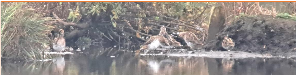
Bekassinen bei der Gefiederpflege

Nach einem leckeren Frühstück fuhren wir nach Wessobrunn. Trotz zähem Hochnebel verbringen wir den ganzen Vormittag an unserem Beobachtungsstandort. Kleinere Trupps von Kleinvögel ziehen an uns in Richtung Süden vorbei. Highlights an dem trüben Herbstmorgen waren Kernbeißer, Gimpel und ein entspannt ruhender Sperber, die sich schön beobachten ließen. Nachmittags am Zellsee begeisterten vor allem Eisvogel und 10 Bekassinen. Den Tagesabschluss verbrachten wir an der Ammermündung mit Blick auf die Fischener Bucht. Wir staunten über etliche Wasservögel wie Pfeif-, Schnatter-, Tafel-, Reiher- und Kolbenenten sowie über eine große Gruppe von circa 200 Kranichen, die klassisch Keilförmig über uns hinweg zogen.