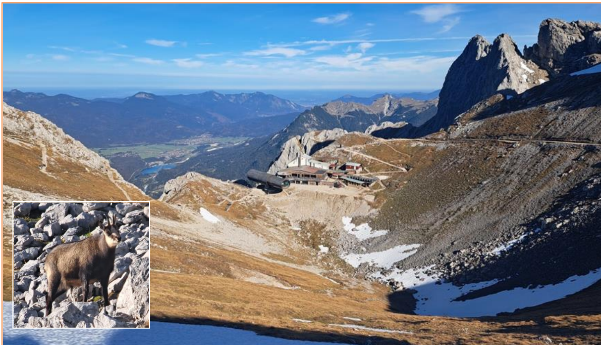
Blick über die Karwendelgrube, Gams

Für heute ist Kaiserwetter im Bereich der westlichen Karwendelspitze angesagt. Mit der zweiten Gondel ging es auf über 2.200 Meter Höhe. Wir umrundeten gemütlich auf dem Passamani-Panorama-Rundweg (1 km) die Karwendelgrube und kamen in den Genuss von Gämsen, Alpenbraunelle, neugierigen Alpendohlen und einigen Schneesperlingen. Alpenschneehühner und Mauerläufer ließen sich zwar nicht blicken, trotzdem genossen wir unsere Mittagspause auf der Terrasse der Berggaststätte bei herrlichem Wetter und Alpenpanorama.