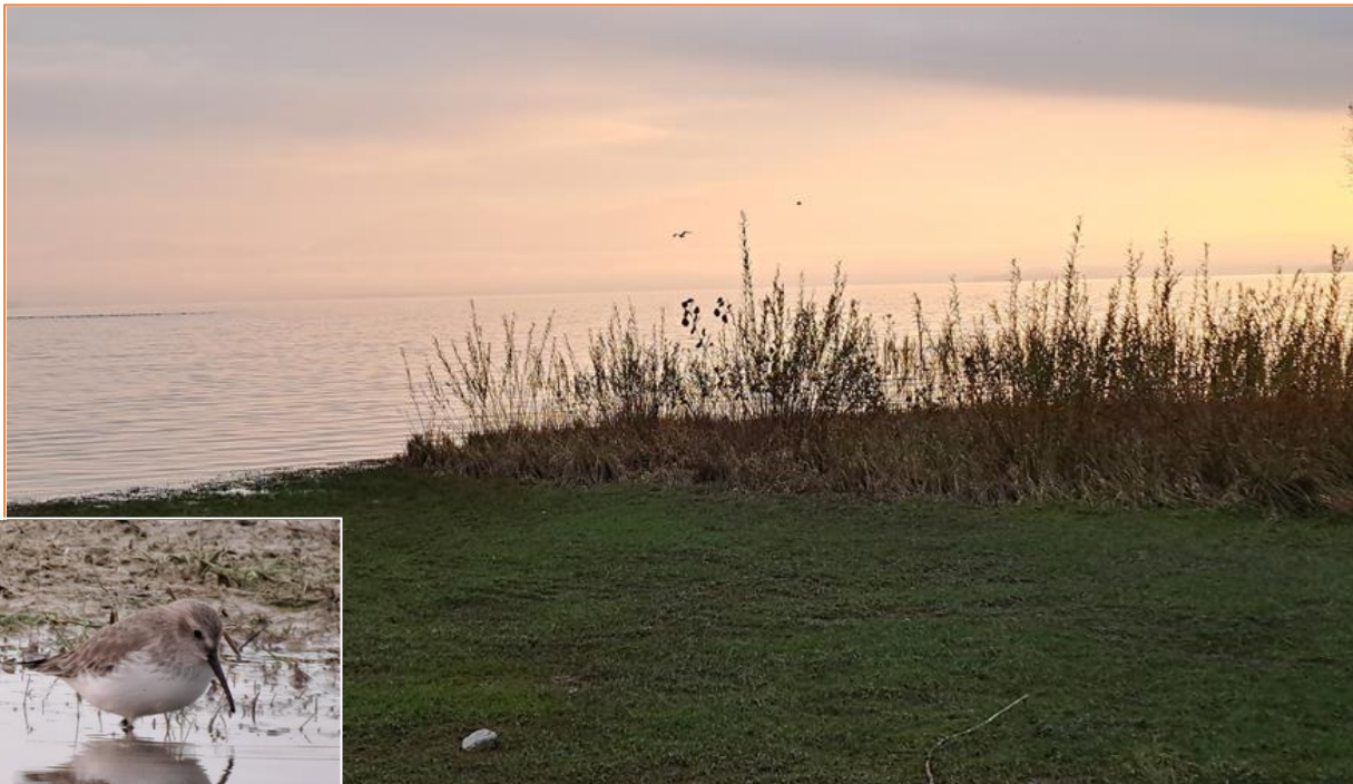
Alpenstrandläufer am Chiemseebad Seebruck

Über die Schafwaschener- und Kailbachbucht, wo wir erneut die Schwimmten in allen Übergangskleidern studieren konnten, endete am Abend bei einem herrlichen Sonnenuntergang am Chiemseebad Seebruck unsere ereignisreiche Runde um das Bayerische Meer.