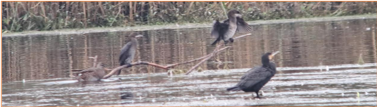
Schnatterente, zwei Zwergscharben und Kormoran

Über die Schafwaschener- und Kailbachbucht, wo wir erneut die Schwimmten in allen Übergangskleidern studieren konnten, endete am Abend bei einem herrlichen Sonnenuntergang am Chiemseebad Seebruck unsere ereignisreiche Runde um das Bayerische Meer.