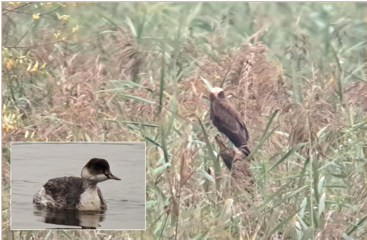
Schwarzhalstaucher und Rohrweihe am Irschener Winkel

Nach einem kurzen Stopp am Autobahnrastplatz Chiemsee mit Blick auf Frauen- und Herreninsel ging es zum Irschener Winkel, wo wir mit Rohrweihe, Schwarzhalstaucher und 4 Zwergscharben gleich mehrere Highlights zu notieren hatten.