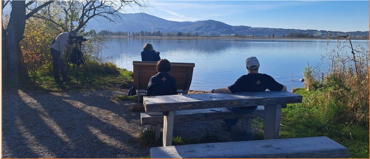
Entspanntes Beobachten am Kochelsee

Nachmittags schauten wir noch am Kochelsee bei Schwarzhalstaucher und Schellente sowie im Loisach-Kochelsee-Moor bei Schwarzkehlchen und Raubwürger vorbei, bevor es zum wirklich guten Abendessen zurück ins Hotel ging.